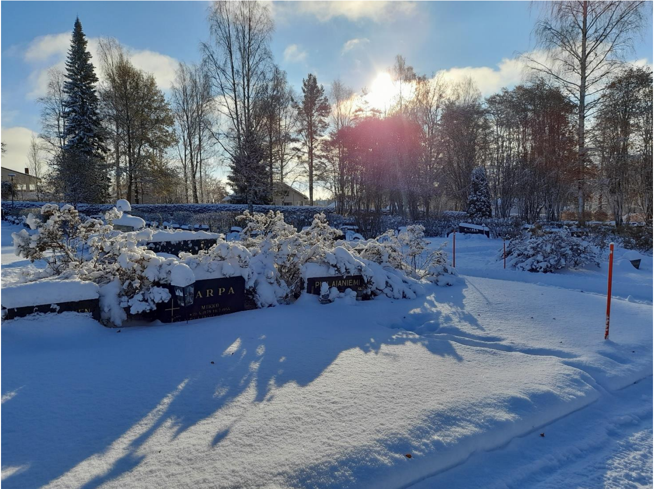
Kankaanpään vanha hautausmaa lumipeitteessä.