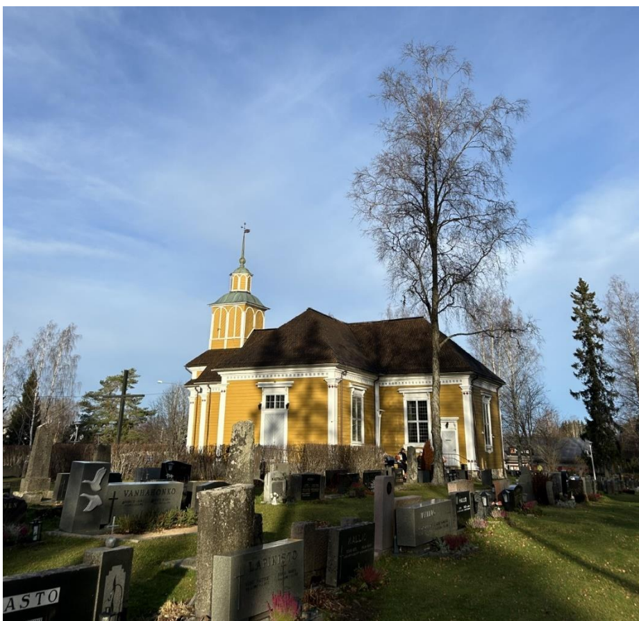
Honkajoen kirkkohautausmaa ja kirkko

Kirkkohautausmaan takana tilat hautausmaan hoidossa tarvittavien maa-ainesten säilyttämiseen.