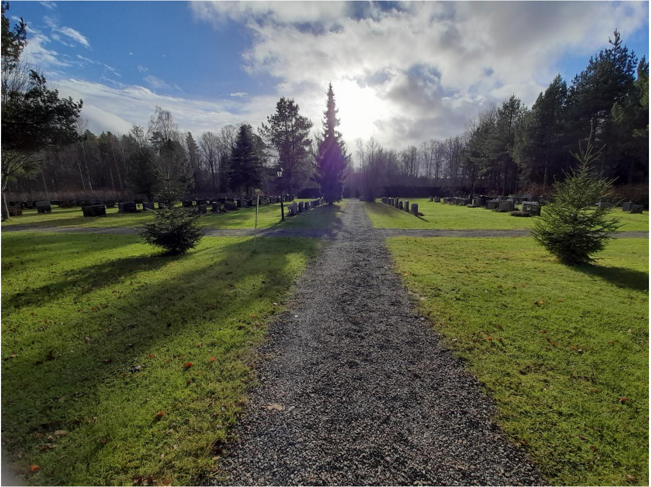
Siikaisten uusi hautausmaa