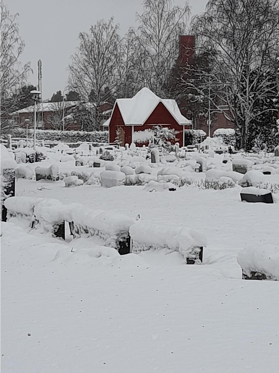
Kankaanpään vanha hautausmaa talvella.

Huoltoalueet ja niiden kehittämistarpeet esitellään tarkemmin kunkin hautausmaan osalta.