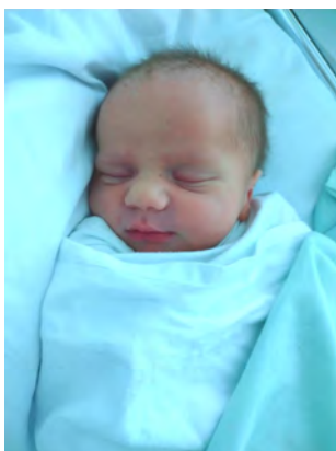
Vauva painoi syntyessään 3.470kg ja 51cm pitkä.

Sairaalassa vietyt päivät ja valvotut yöt alkoivat pian käydä voimille. Vietimme kaiken kaikkiaan viikon sairaalassa. Koskaan ennen ei ole tarvinnut yrittää selviytyä niin vähillä yöunilla. Vauvaa piti herätä syöttämään kolmen tunnin välein vuorokauden ympäri, eikä nukkuminen onnistunut sen paremmin päivälläkään.