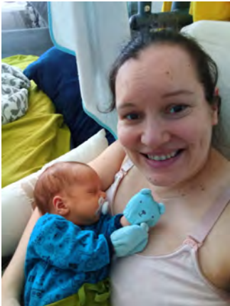
Kaikkien käännteiden jälkeen olemme vihdoon taas kaikki yhdessä kotona.