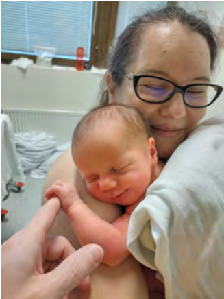
Olimme synnytyksen jälkeen neljä vuorokautta sairaalassa, jotta vauvan paino lähtisi kunnolla nousuun.