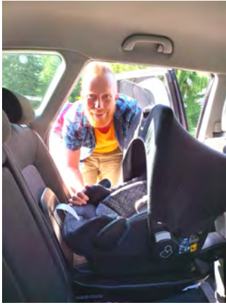
Turvaistuin on valmiina pientä matkustajaa varten.

Elokuun yksi huippuhetkestä oli Kansanlähetyksen lähetystyöntekijöiden päivät Ryttylässä eli tuttavallisemmin "lähettipäivät". Oli kiva nähdä entisiä ja nykyisiä kollegoja eri puolilta maailmaa ja Suomea. Monia heistä tapaamme vain harvoin, kun kotimaanjaksot eivät useinkaan ole samaan aikaan. Eikä Papua-Uudesta-Guineasta ole helppo osallistua Suomen tapahtumiin edes etäyhteyksien avulla aikaeron ja nettiyhteyden ongelmien vuoksi.