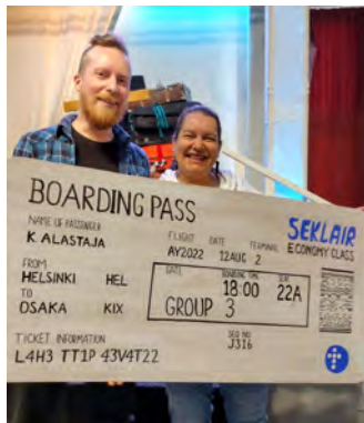
Lähettipäivillä lavan koristeena oli jättikokoinen matkalippu.

Älkää maksako kenellekään pahaa pahalla, vaan pyrkikää siihen, mikä on hyvää kaikkien silmissä. Jos on mahdollista ja jos teistä riippuu, eläkää rauhassa kaikkien kanssa