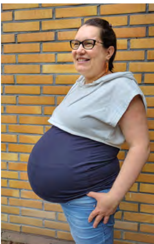
Raskausviikko 39 ja ensi viikolla käynnistetään synnytys.