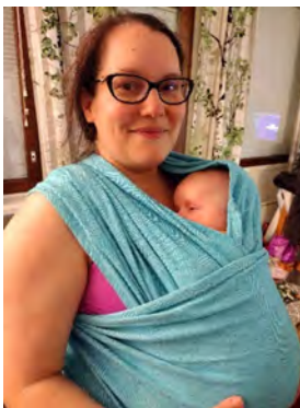
Väsänyt lapsi kantoliinassa.