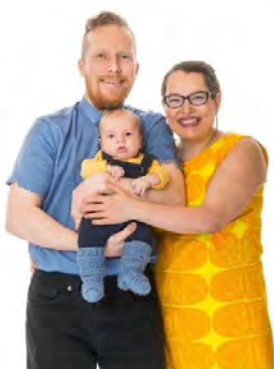
Meidän uusin perhepotrettikuva.